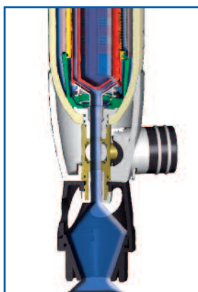
Proces zpětného proplachování