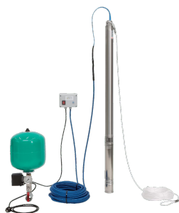
Zadešřtovací souprava Wilo TWU 3 Plug &amp; Pump Sub-II